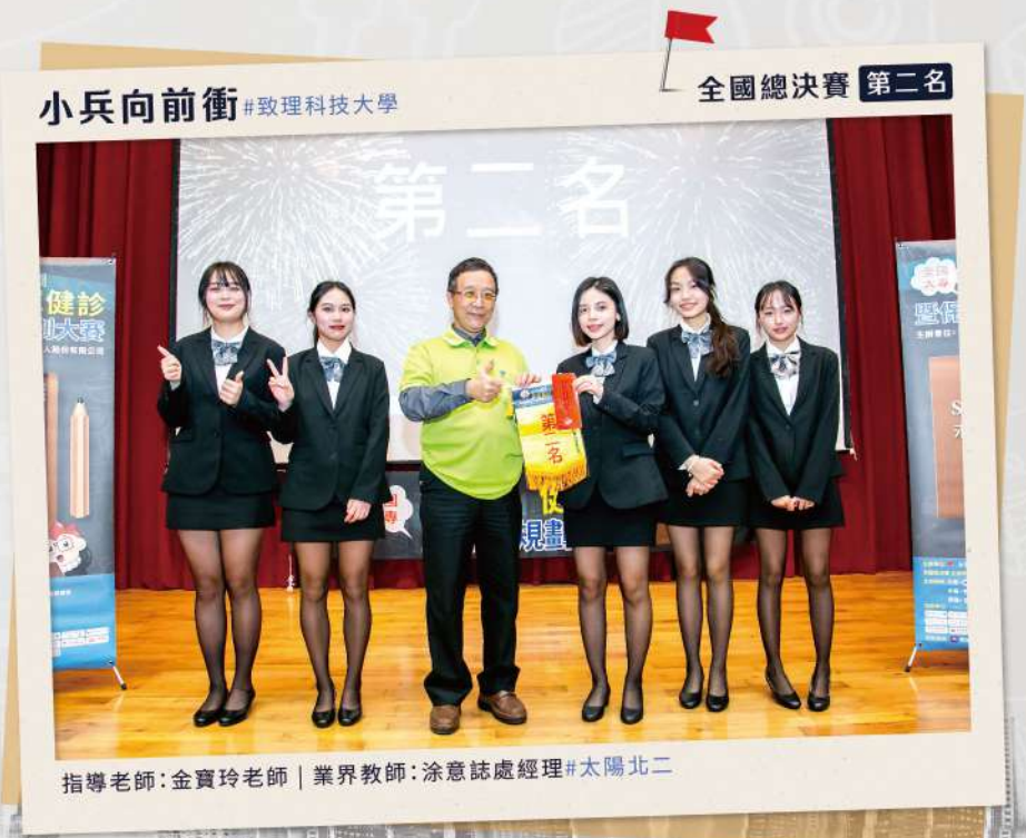
指導老師：金寶玲老師 | 業界教師：涂意誌總經理#太陽北二