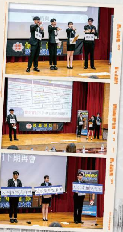
保,我在 #致理科技大學