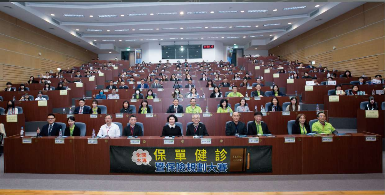
全國總決賽—國立臺中科技大學