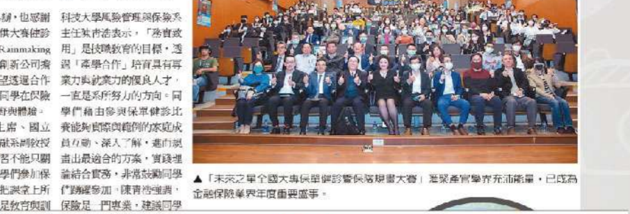
▲「未來之星全國大專保單健診暨保險規劃大賽」獲獎產官學界齊聚一堂，已成為金融保險界年度重要盛事。

「保單健診」的概念，近幾年在保險業界的大力推廣下，已讓民眾更清楚，過去雖有的保險，不代表符合現在與未來所需要，每年重新檢視才能讓「風險規劃」達到良好成效。每年舉辦的「未來之星全國大專保單健診暨保險規劃大賽」更同時扮演著理念宣導與教育傳承的重要平台。日前，該活動公布第八屆總決賽成績，致理必得(致理科大)、保你一生(臺中科技大学)、48獎(樹德科大)3隊，分獲北中南冠軍。 「保單健診」的概念，近幾年在保險業界的大力推廣下，已讓民眾更清楚，過去雖有的保險，不代表符合現在與未來所需要，每年重新檢視才能讓「風險規劃」達到良好成效。每年舉辦的「未來之星全國大專保單健診暨保險規劃大賽」更同時扮演著理念宣導與教育傳承的重要平台。日前，該活動公布第八屆總決賽成績，致理必得(致理科大)、保你一生(臺中科技大学)、48獎(樹德科大)3隊，分獲北中南冠軍。