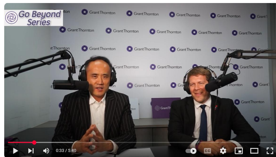
臺美職場上的文化差異-Go Beyond Series